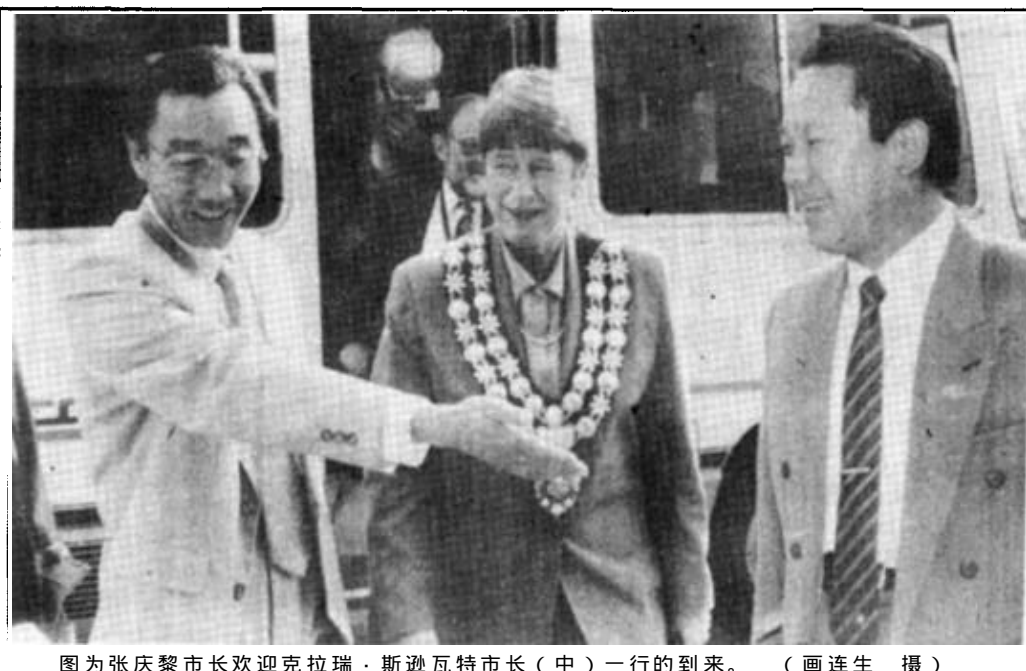
图为张庆黎市长欢迎克拉克·斯通瓦特市长(中)一行的到来。

本报讯 新西兰普利茅斯市政府代表团，在克拉克·斯通瓦特市长的率领下，于10月12日抵达我市，进行为期三天的友好访问。