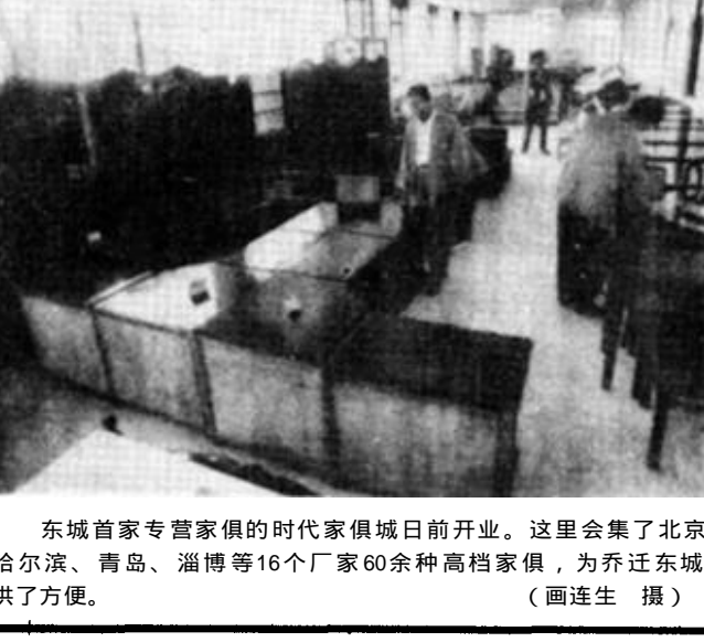
东城首家专营家具的时代家具城日前开业。这里汇集了北京、天津、哈尔滨、青岛、淄博等16个厂家60余种高档家具，为乔迁东城的居民提供了方便。